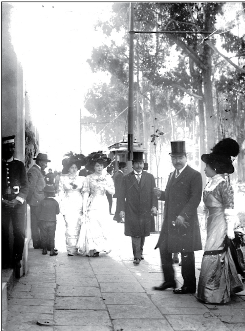
FOTO 1. Paseo de la élite