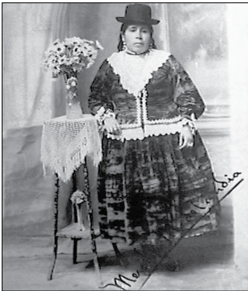
FOTO 8. Retrato de chola paceña