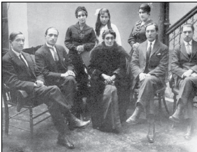
FOTO 6. Familia en domicilio particular