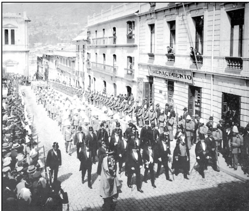
FOTO 5. Desfile presidencial

sombrero, frack). En segundo lugar en importancia se encuentran autoridades militares que van o al lado de las civiles o atrás. Entre ellas, están las que denotan más poder y aquellas que sólo juegan un rol de escolta. Finalmente, los observadores pasivos.