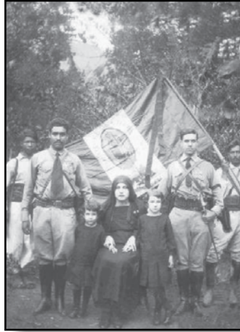
Familias del Regimiento Valparaíso