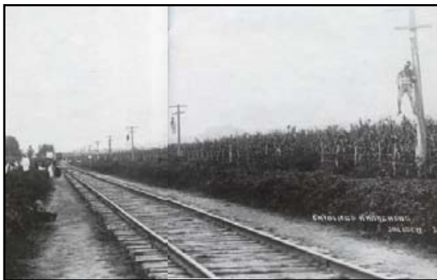
Ahorcados católicos en rieles de Jalisco