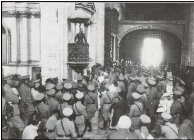
General Joaquín y Amaro en templo de San Agustín.