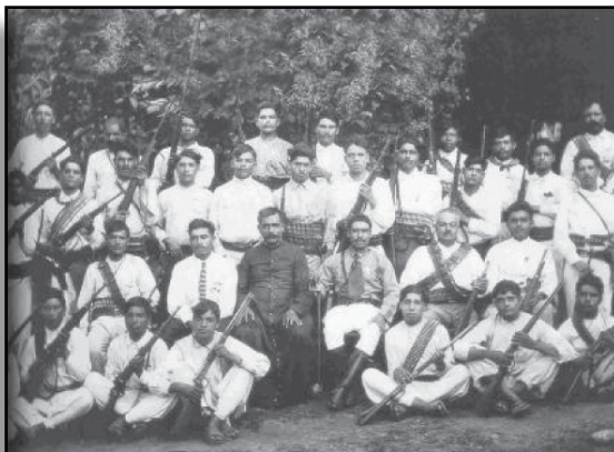
Cristeros de Zacatecas