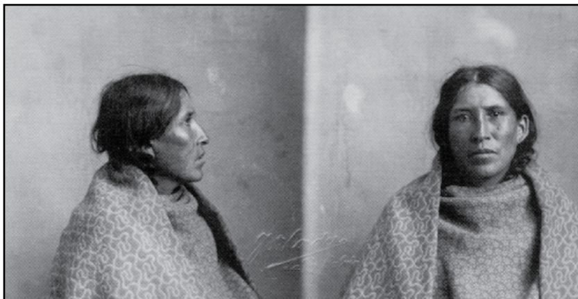
FOTO 4. Mujer presa

y otros, es decir una posición particularmente privilegiada con respecto a aquellos que deben cumplir labores de menor categoría.