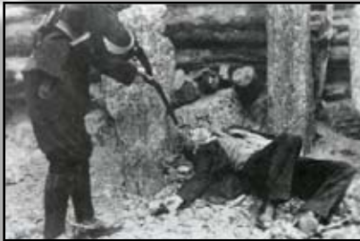
Fotos fusilamiento de Miguel Agustín Pro.