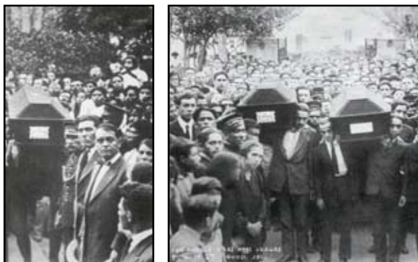
Fotos entierro cristero y entierro federal.

Es conocido que la estructura familiar jugó un rol fundamental en la Guerra Cristera. Es una lucha que involucra directamente a la familia y cada uno de sus miembros juega un rol particular. No existe un solo modelo sino varios de familia: padre e hija, esposos e hijos, amigos y parientes, etc. Las clases sociales también se diferencian: familia campesina, burguesa, urbana, intelectual.