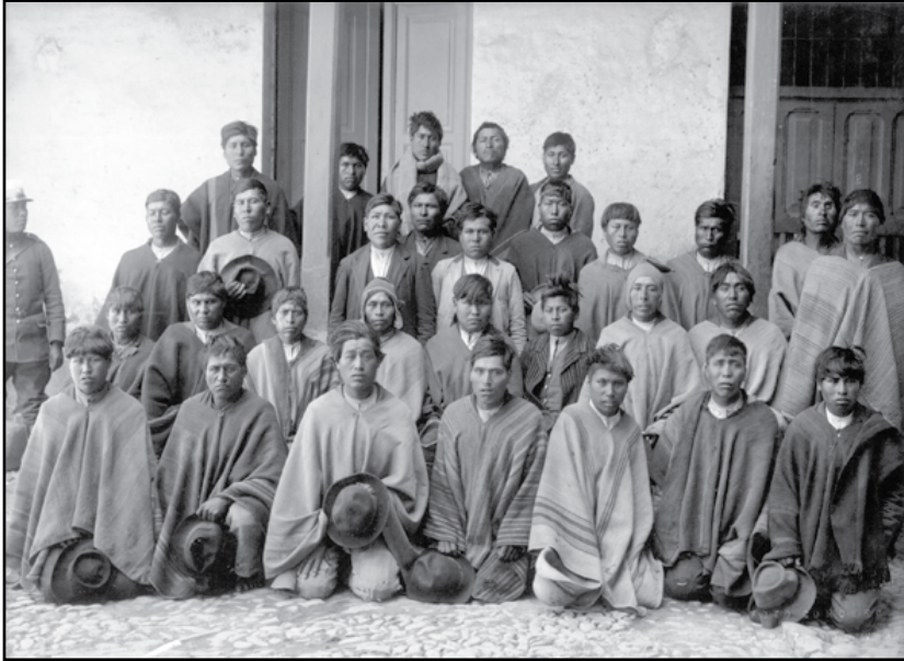
FOTO 3. Presos indígenas en la cárcel de La Paz

La foto N° 3 nos muestra un colectivo indígena, todos prisioneros y despersonalizados, que miran hacia la foto; al fondo son observados por un atento vigilante. Por último, en la foto N° 4, de criminalística, podemos ver una mujer privada de cualquier objeto connotativo.