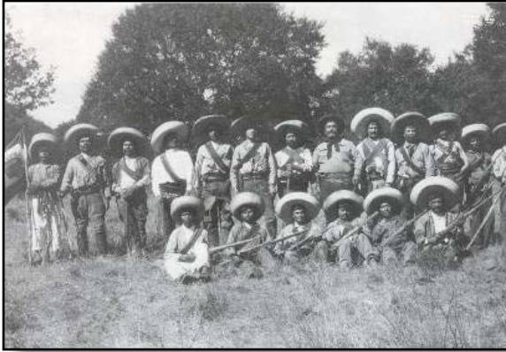
Tropa General Rodolfo Gallegos