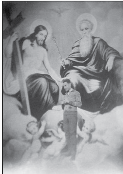
Estampa de José de León Toral ante la Santísima Trinidad.

Los íconos aparecen acompañados de fieles que pueden ser civiles o estar armados; la reverencia es constante y enseña una forma de protección. Dado