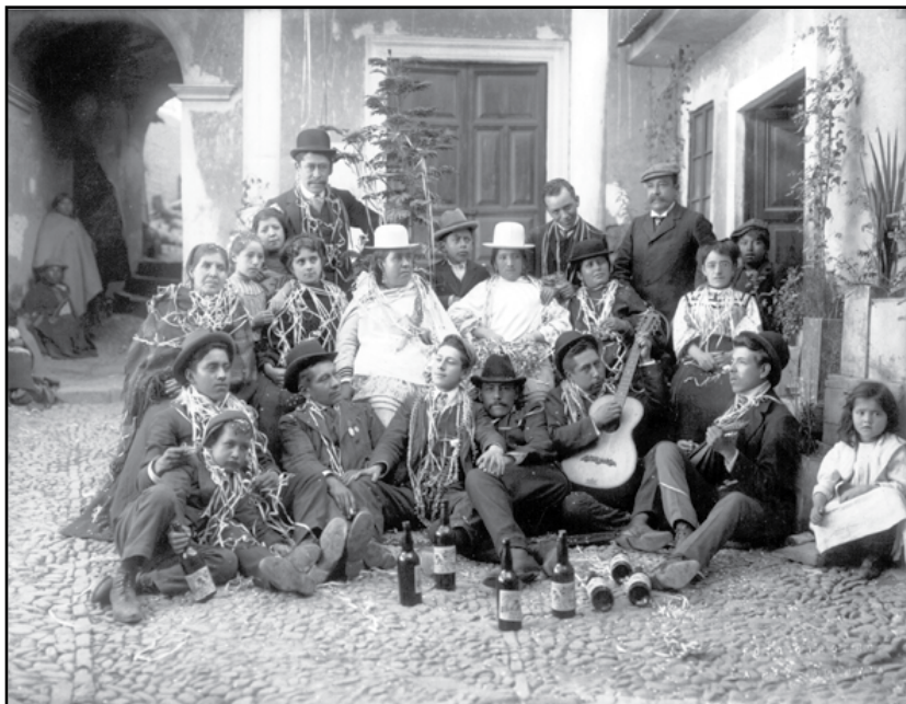
FOTO 2. Fiesta en patio interior

En la foto N° 1 a través de los códigos de adelante/detrás, participa/observa, podemos ver cómo se dibujan dos mundos, uno en el cual la élite se posesiona de la calle utilizándola para su diversión, mientras que los demás se limitan a la a la observación pasiva.