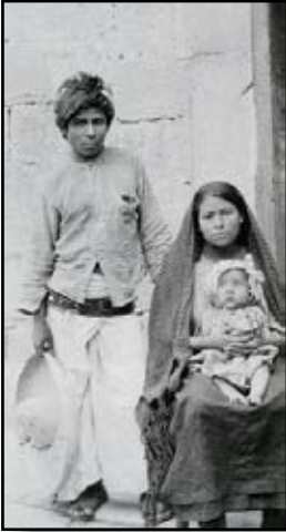
Familia cristera campesina