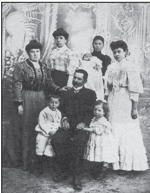
FOTO 7. Familia en estudio